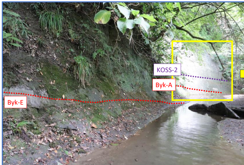
小草畑セクションの露頭

また、千葉セクションから南西に1.7kmほど離れた柳川セクションでも同様でありGSSP申請グループの説明では『千葉セクション近傍のみ、KOSS-2スコリア層が存在しない』という事になり、不整合または無堆積（地層の不連続）を示唆するものとなる。